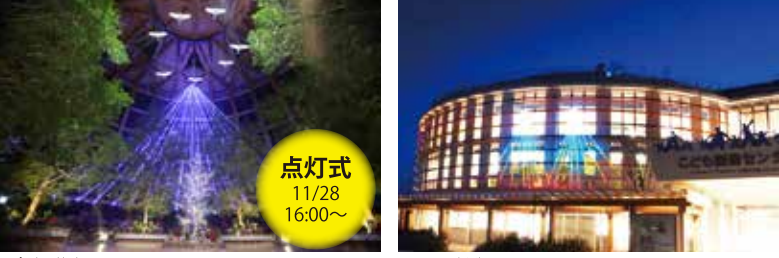
▲食育・花育センター ▲こども創造センター

キラキラガーデン(花とみどりの展示館)では同期間は毎日点灯をおこない、プロジェクションマッピングや光のデコレーションツリーが新たに登場します。詳しくは裏面をご覧ください。