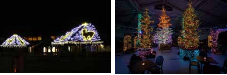
▲動物ふれあいセンター ▲花とみどりの展示館