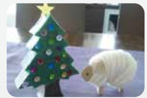
▲デコパージュクリスマスツリーと毛糸まきまき羊

この他にも、 通常のものづくりひろばでの 活動や、クライミングウォール もあります。 どうぞお楽しみ下さい。